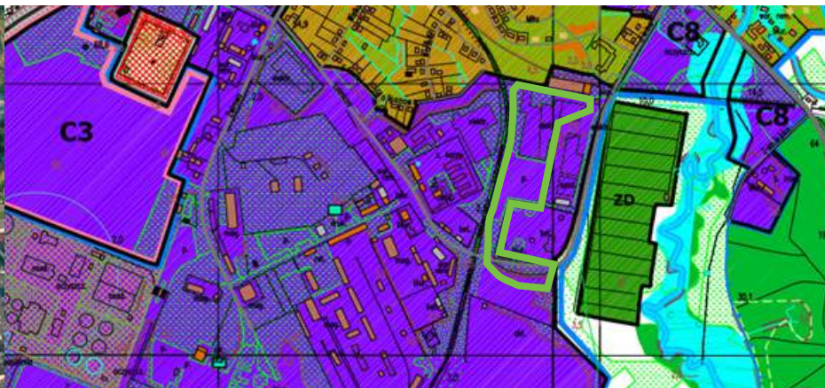
Kierunki przeznaczenia terenów / Use of land